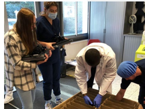
← 1.040 laptops verdeeld na de overstromingen in juli 2021

De negen gemeentes waar we laptops verdeelden waren Trooz, Pepinster, Verviers, Esneux-Tilff, Limbourg, Theux, Luik, Chaudfontaine en Rochefort. De lokale OCMW's organiseerden de verdeling. Zij bepaalden wie in aanmerking kwam voor een laptop.